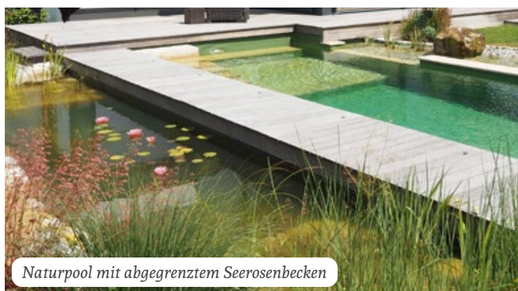
Naturpool mit abgegrenztem Seerosenbecken