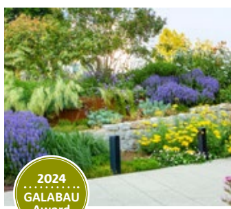
1. Platz Öffentl. Gärten kleiner als 250 m 2 I'm Inn Zwettl – Hotel zum Brauhaus