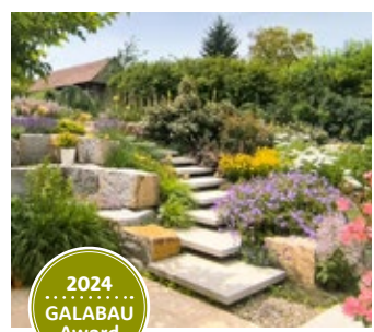
1. Platz Privatgarten über 250 m 2 „Aus Stein geschlagen, vom Wasser geformt, auf Blüten getragen“