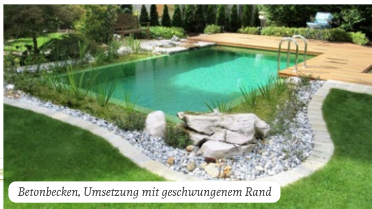
Betonbecken, Umsetzung mit geschwungenem Rand