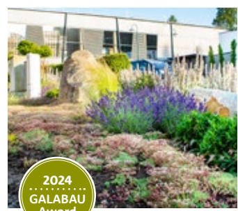
1. Platz „Die große Idee fürs kleine Budget“ Vorplatz der Brauerei Zwettler

Anerkennungen unserer Leistungen durch eine Fachjury