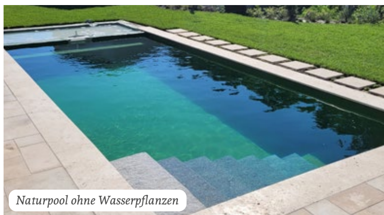
Naturpool ohne Wasserpflanzen