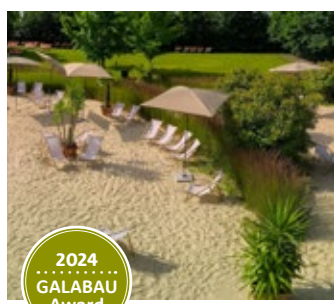
1. Platz Öffentl. Gärten größer als 250 m 2 Strandbar der Therme Laa